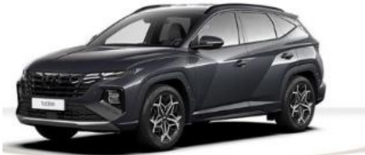
Abbildung ist als unverbindlich zu betrachten. Fahrzeugabbildungen enthalten z. T. optionalpflichtige Sonderausstattungen.