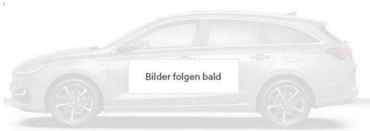
Abbildung ist als unverbindlich zu betrachten. Fahrzeugabbildungen enthalten z. T. aufpreispflichtige Sonderausstattungen.