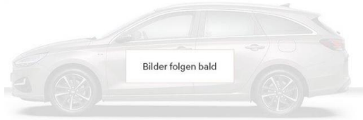
Abbildung ist als unverbindlich zu betrachten. Fahrzeugabbildungen enthalten z. T. aufpreispflichtige Sonderausstattungen.