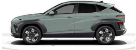
Abbildung ist als unverbindlich zu betrachten. Fahrzeugabbildungen enthalten i. T. aufpreispflichtige Sonderausstattungen.