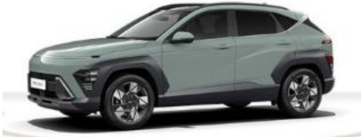
Abbildung ist als unverfälscht zu betrachten. Fahrzeugabbildungen enthalten z. T. aufpreispflichtige Sonderausstattungen.