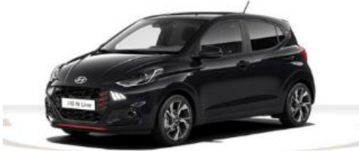
Abbildung ist als unverbindlich zu betrachten. Fahrzeugabbildungen enthalten z. T. aufpreispflichtige Sonderausstattungen.