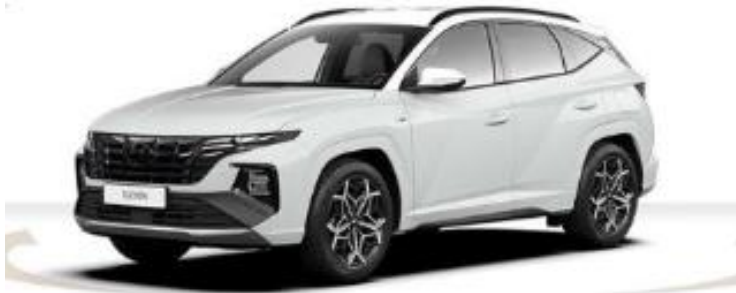
Abbildung ist als unverbindlich zu betrachten. Fahrzeugabbildungen enthalten z. T. auftragsabhängige Sonderausstattungen.