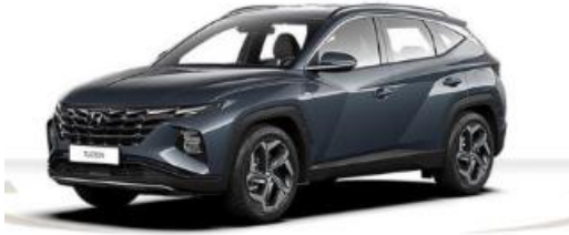
Abbildung ist als unverbindlich zu betrachten. Fahrzeugabbildungen enthalten z. T. auftragspflichtige Sonderausstattungen.