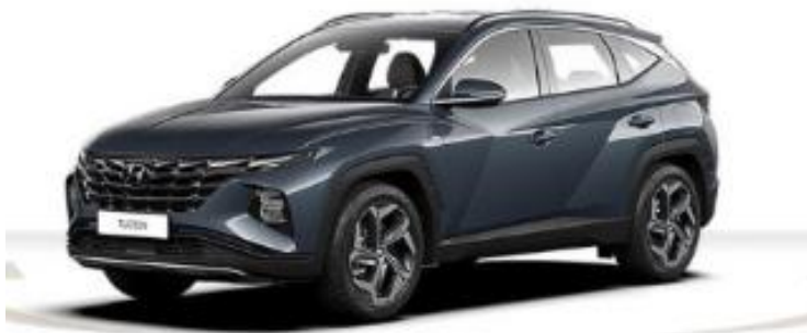
Abbildung ist als unverbindlich zu betrachten. Fahrzeugabbildungen enthalten z. T. zu leistungsfähige Sonderausstattungen.