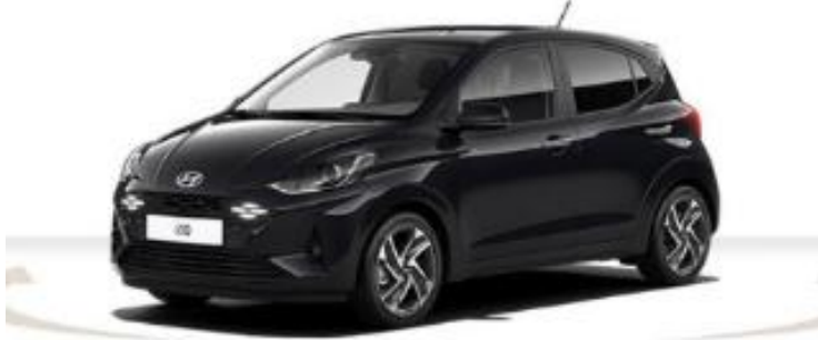
Abbildung ist als unverbindlich zu betrachten. Fahrzeugausstattungen enthalten z. T. aufpreispflichtige Sonderausstattungen.