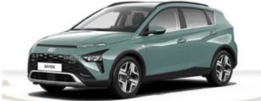
Abbildung ist als unverbindlich zu betrachten. Fahrzeugabbildungen enthalten z. T. aufpreispflichtige Sonderausstattungen.