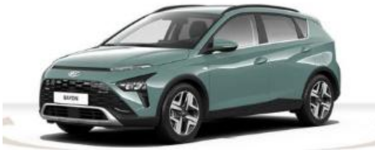
Abbildung ist als unverbindlich zu betrachten, Fahrzeugabbildungen enthalten z. T. autorisierpflichtige Sonderausstattungen.