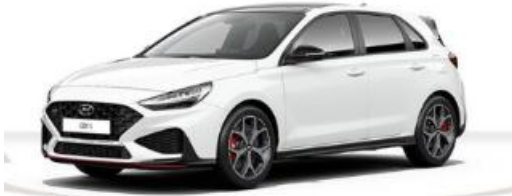
Abbildung ist als unverbindlich zu betrachten. Fahrzeugabbildungen enthalten z. T. aufpreispflichtige Sonderausstattungen.